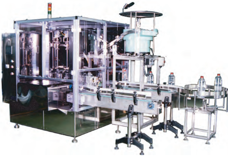
少量自動充填機 (2連式・打栓キャップ付き)