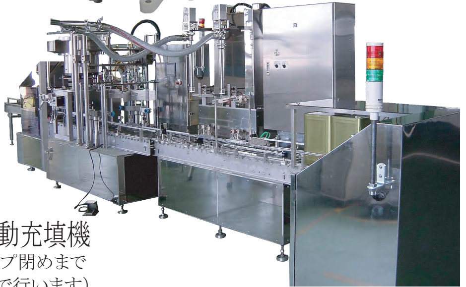
一斗缶用自動充填機 (充填からキャップ閉めまで 自動で行います)