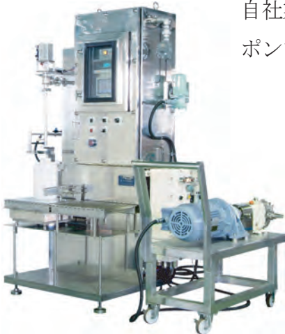
半自動防爆充填機